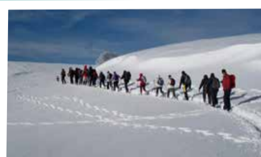
Sortie raquettes dans le Bugey à «Cuvery»

Le dimanche 8 février, la sortie en raquettes dans le Bugey animée par l'association Découverte et Création a fait découvrir à 21 personnes des paysages sublimes malgré le froid (-8°C) !