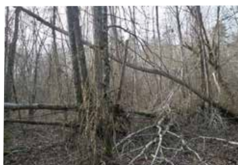
Les peupliers fragilisés du parc