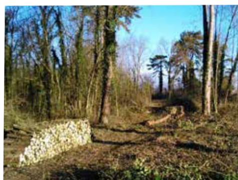
Coupes de bois en cours