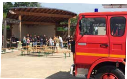
Vente de tartes des pompiers