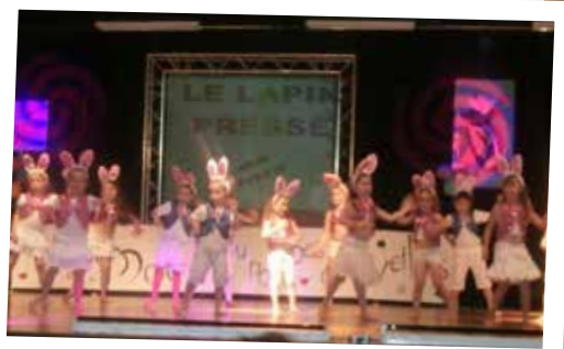
Gala de fin d'année Mix'Mouv