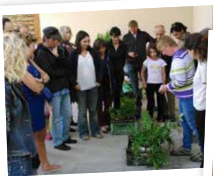
Troc aux plantes