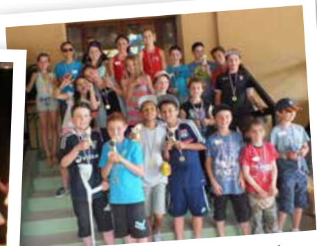
Pétanque du «Sou des Ecoles»

► Samedi 16 mai : Le troc aux plantes a réuni plus d'une vingtaine de personnes sur la place avec cette année la présence de nouveaux passionnés.