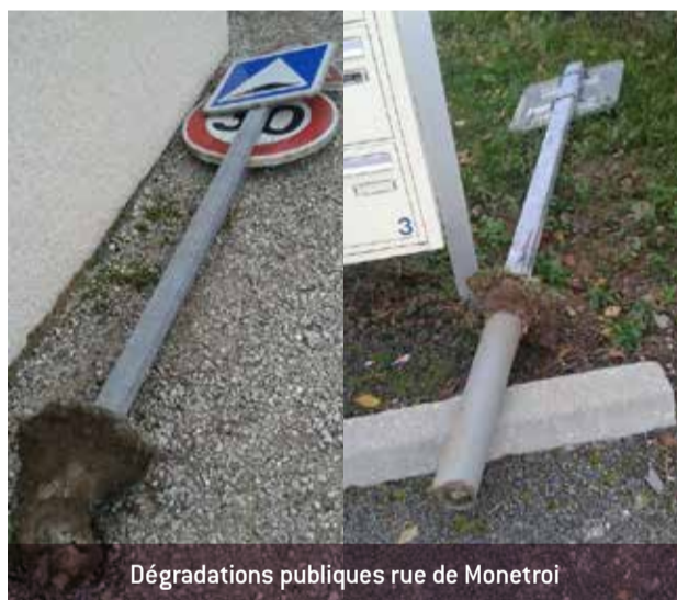
Dégradations publiques rue de Monetrot

Prochain conseil municipal Mardi 13 décembre à 20h en mairie