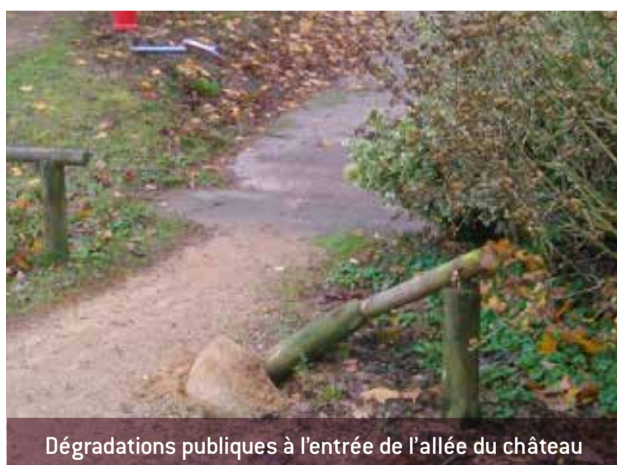
Dégradations publiques à l'entrée de l'allée du château

Conception et rédaction : Mairie de Charnoz / Commission Communication.