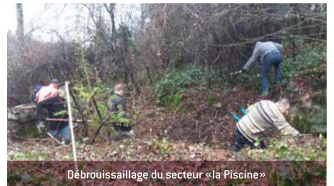
Débroussaillage du secteur «la Piscine»

La commission remercie les bénévoles qui ont aidé au débroussaillage du secteur du four à bois, dit la «piscine». Un nouveau rendez-vous est donné à tous les volontaires le 3 décembre de 8h à 12h pour continuer cette opération de nettoyage. Venez avec bottes, sécateurs et bonne humeur !