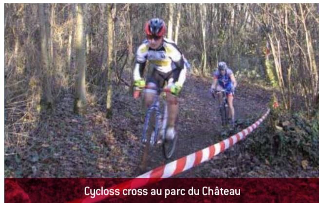
Cyclocross au parc du Château

Le cyclocross organisé par la Roue Sportive de Meximieux (épreuve de support au championnat départemental de la FSGT 69) s'est déroulé au château le 26 novembre sous une météo magnifique.