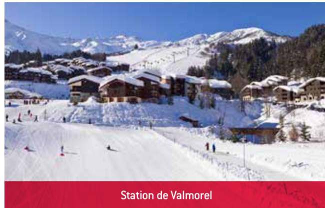
Station de Valmorel

Le Club des Jeunes organise une sortie de ski le samedi 28 janvier 2017 à Valmorel. Pensez à réserver ! (Nombre de places limité). Rendez-vous à 6h30 au château pour un départ à 6h45 et retour prévu vers 19h30 au château.