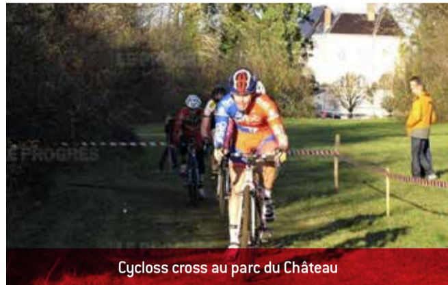
Cyclocross au parc du Château

Le cyclocross organisé par la Roue Sportive de Meximieux (épreuve de support au championnat départemental de la FSGT 69) s'est déroulé au château le 26 novembre sous une météo magnifique.