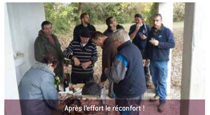
Après l'effort le réconfort !